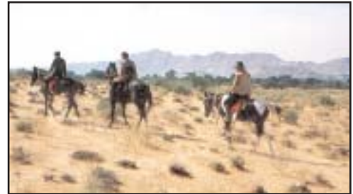
Pistes dans la région de Jodhpur.