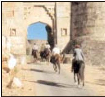
Kumbhalgarh : entrée du fort.

Pour quelles raisons élaborer un projet de cette envergure ? Tout simplement parce qu'une telle épreuve manquait, dans cette discipline, au calendrier des aventuriers et amateurs de grands espaces. Ayant réalisé plusieurs randonnées équestres au RAJASTHAN, l'idée d'un raid, alliant une activité sportive et une évasion touristique dans ce merveilleux pays, était une suite logique dans notre volonté de partager des sensations exceptionnelles et des expériences inoubliables avec d'autres cavaliers.