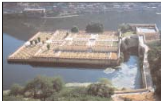
Jardins Moghols : Fort d'Amber..