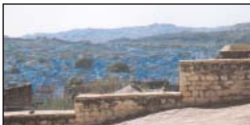
Jodhpur : la ville bleue.