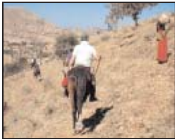
Région de Udaipur : les monts Aravalli.

Pour quelles raisons élaborer un projet de cette envergure ? Tout simplement parce qu'une telle épreuve manquait, dans cette discipline, au calendrier des aventuriers et amateurs de grands espaces. Ayant réalisé plusieurs randonnées équestres au RAJASTHAN, l'idée d'un raid, alliant une activité sportive et une évasion touristique dans ce merveilleux pays, était une suite logique dans notre volonté de partager des sensations exceptionnelles et des expériences inoubliables avec d'autres cavaliers.