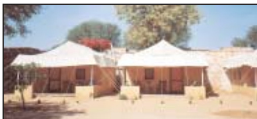
Camp de Samode.