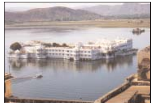
Lake Palace : Udaipur.