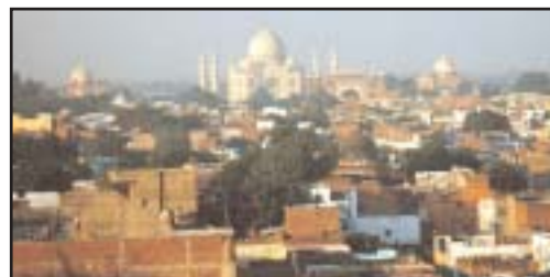
Agra : le Taj Mahal.