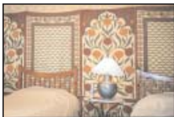
Camp de Samode : départ du raid.

Jaipur - Samode - Chomu - Kishangarh - Jobner - Phuler - Sambhar - Nawan - Makrana - Parvatsar - Pushkar - Ajmer - Bharunda - Padu - Kalan - Lampolai - Merta - Indawar - Kherjadala - Rian - Binawas - Banar - Jodhpur - Kankani - Luni - Rohit - Pali - Gundoch - Nadol - Desuri - Garbor - Kumbhalgarh - Ranakpur - Udaipur