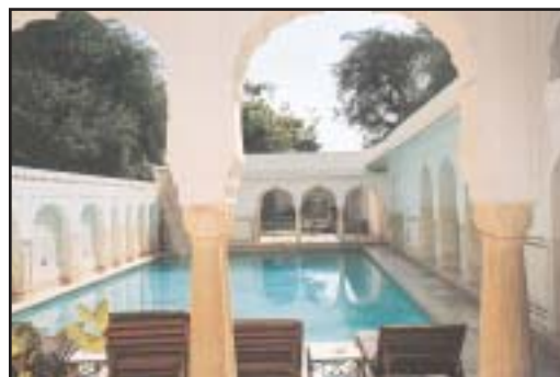
Camp de Samode.